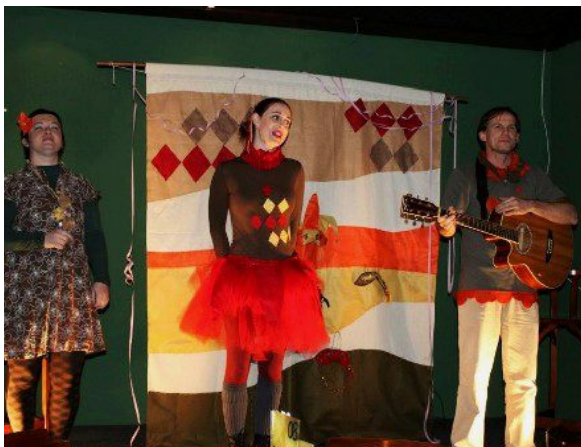
Espectáculo "Orfeu" (2012)