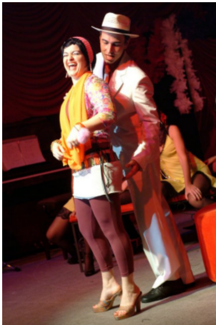
Musical "Ópera do Malandro" - Grupo de Arte Alina Lamparina - Brusque SC - 2004