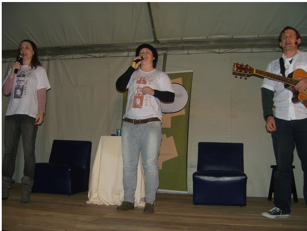
Projeto Poesia ao Pé da Lua – SESC (2011)