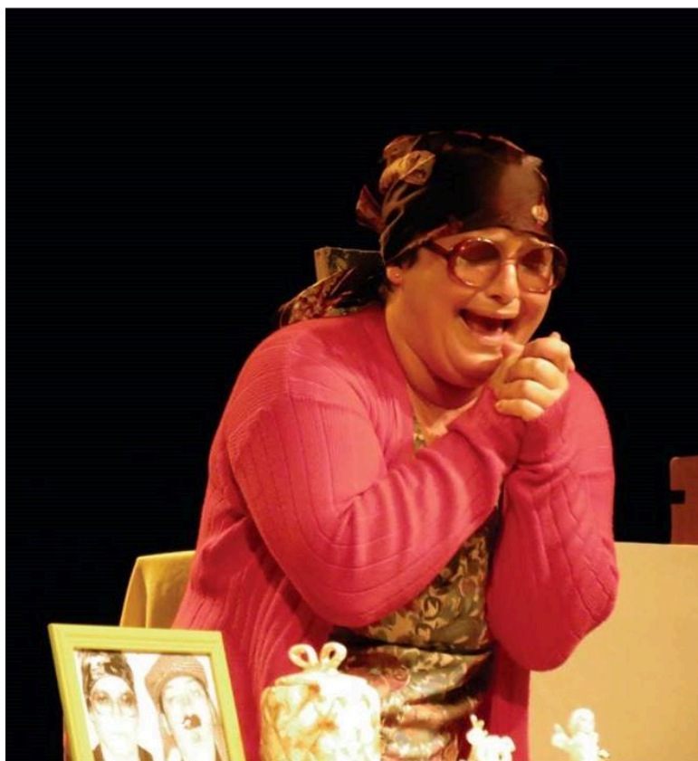
Peça teatral “Telefone sem fio” (2016) no Teatro de Azambuja (Brusque/SC)