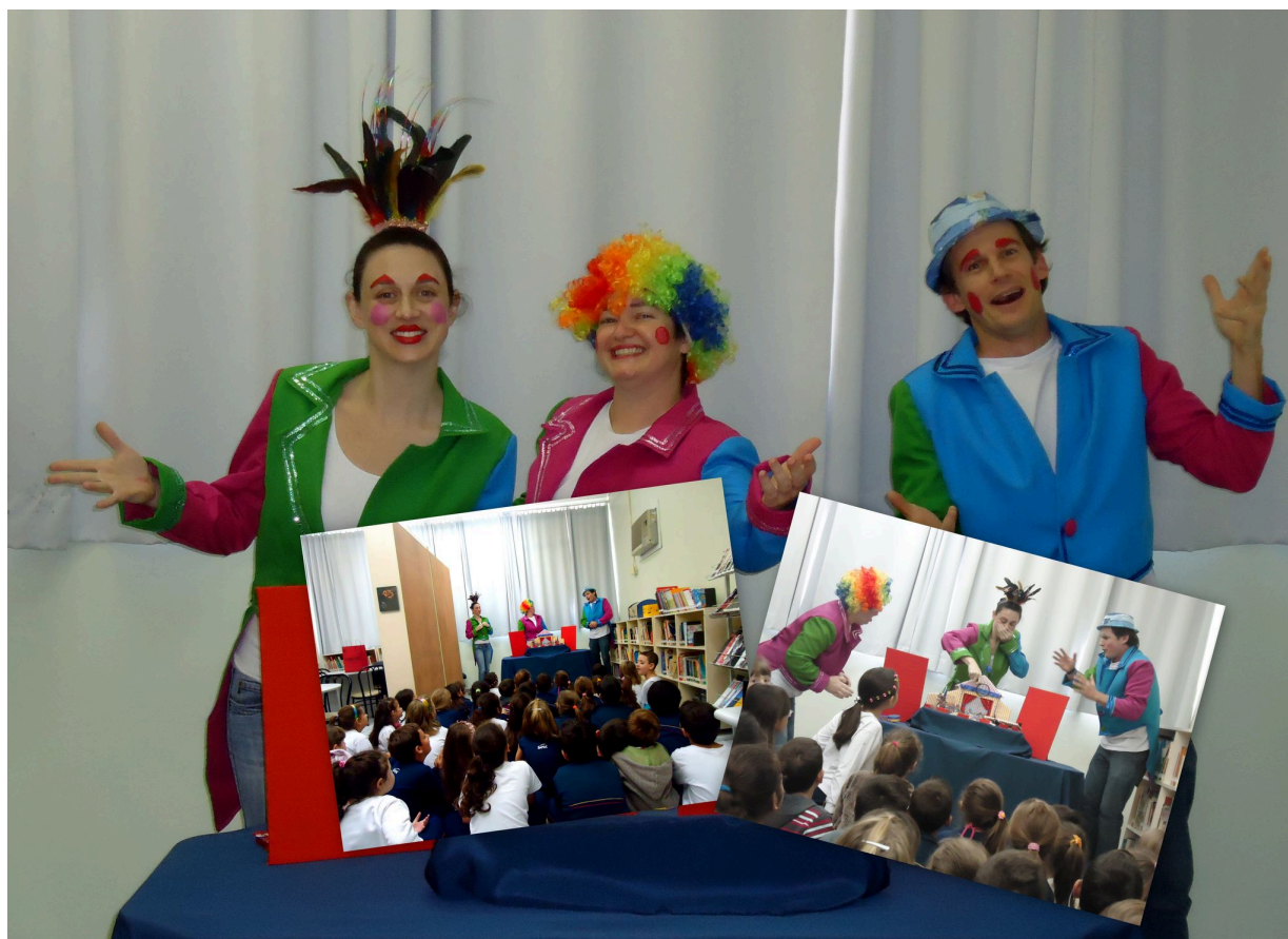
Espectáculo "O grande circo da Arca de Noé" (2013)