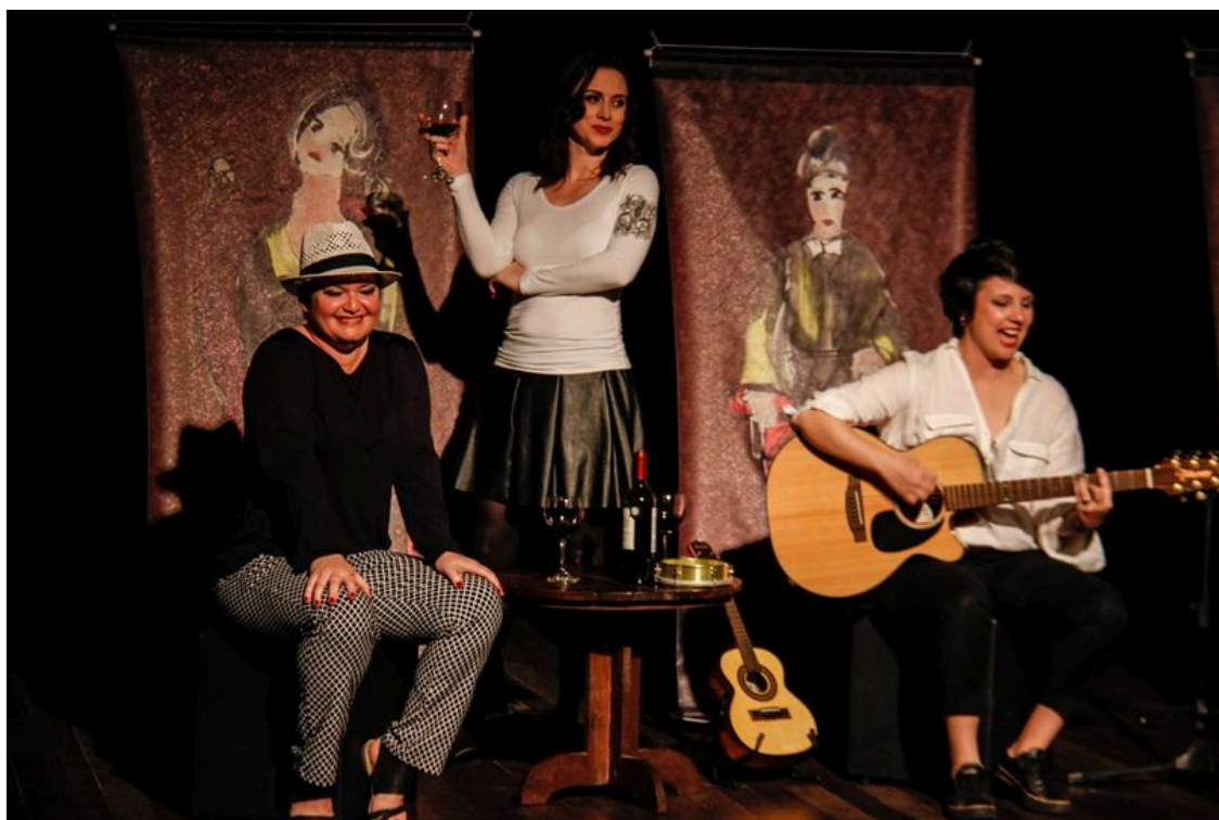
Espetáculo “Palavra de Mulher” (2014)